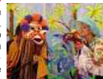
Les aventuriers de l'armoire oubliée, Compagnie Patchwork

P'tit Lou passe tous ses mercredis chez sa grand-mère, Mamino. Un jour, l'enfant ouvre l'armoire du grand-père qu'il n'a jamais connu. Costumes, marionnettes et masques réaniment le cœur de Mamino qui avait bien du mal à battre depuis la disparition de son mari, un artiste inventif et plein de fantaisie ! Ses souvenirs s'animent, entraînant P'tit Lou dans une aventure riche en voyages. Par la Compagnie Patchwork. À partir de 4 ans.