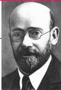
J. Korczak, 1920

Atelier création de jeu : mercredis 10 et 17 novembre de 14h30 à 18h30 - Espace Ludique Marcel Aymé