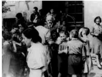
Korczak, 1934

Préserver l'innocence de l'enfance constitue le premier des droits de l'enfant. Il s'agit de mieux comprendre le témoignage de Janusz Korczak afin de prévenir les violences, de lutter contre le racisme et de renforcer le lien entre les générations.