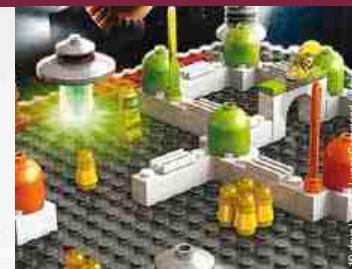
10 days before / Lunat Chimmanat / A&amp;P