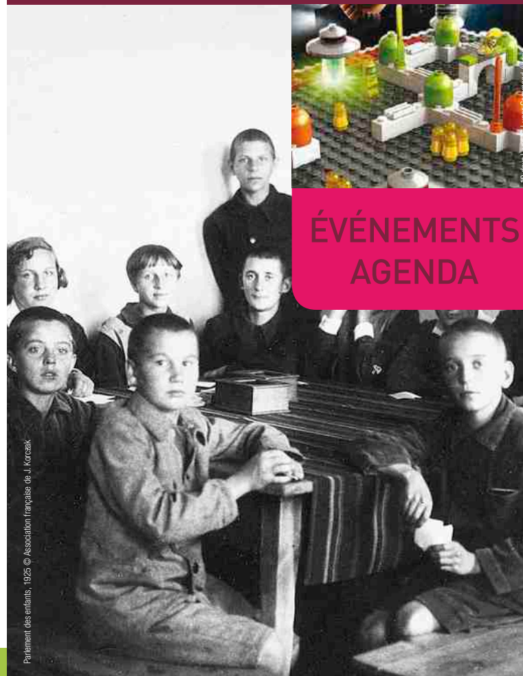
Parlement des enfants, 1925