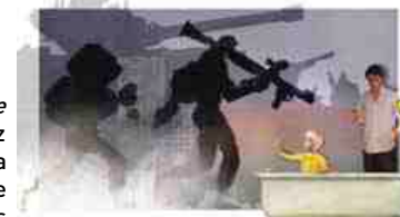
Même pas morte, Mabel Octobre

Dans le sillage de la « République des Enfants » conçue par Janusz Korczak, l'accès aux droits, à la paix et à la justice constitue une impérieuse affirmation des droits des enfants afin de combattre les violences et injustices de toutes sortes.